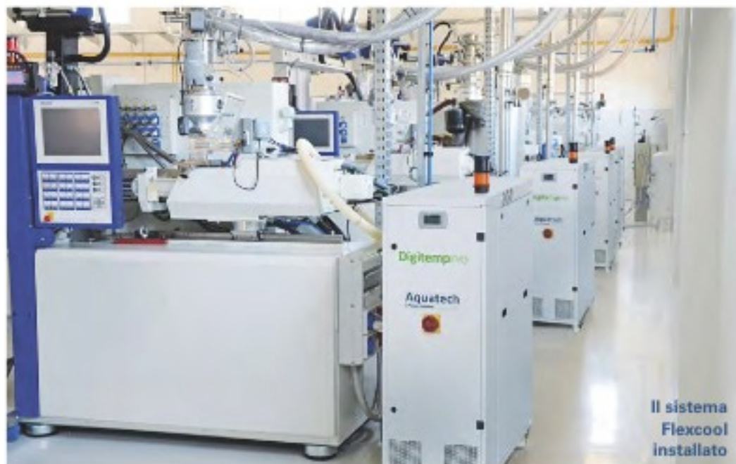
Il sistema Flexcool installato